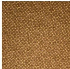
ANATOLE Or 94 Motif d'impression