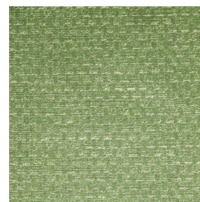
RUSTIC Mousse 92