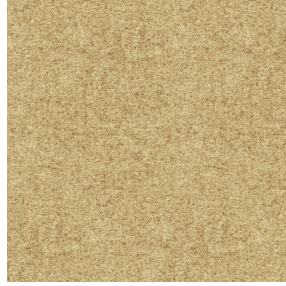
ELAINA Beige 63 Motif d'impression