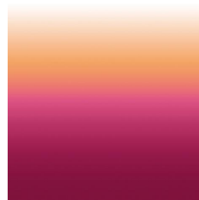
ZADIG Pivoine 57