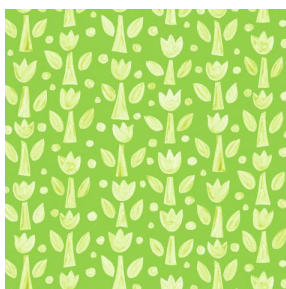
TULIPE Anis 62