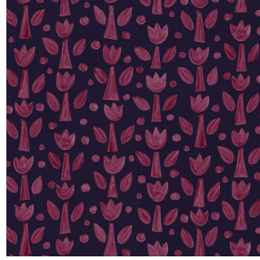
TULIPE Bordeaux 04 Motif d'impression