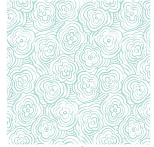
ONDES glacier 43