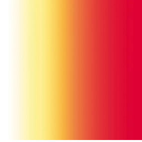
ZENITH Agrume 69 Motif d'impression