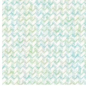
6017 Bleu 41 Motif d'impression