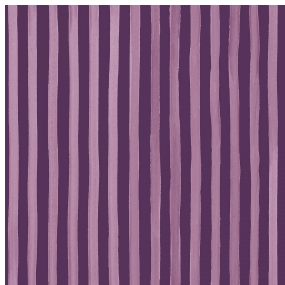
SONG Prune 84 Motif d'impression