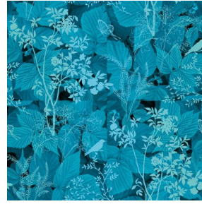
ODE Turquoise 53