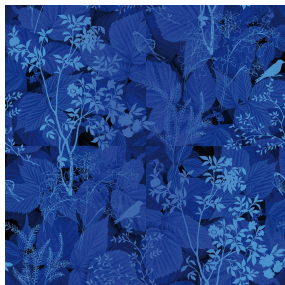
ODE Bleu 41 Motif d'impression