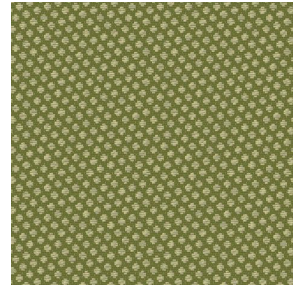
GONIDIE Mousse 92