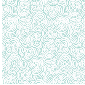
ONDES glacier 43 Motif d'impression