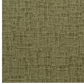
MURA OLIVE 61 Motif d'impression