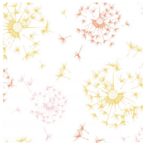
PUNSIKA OCRE 03