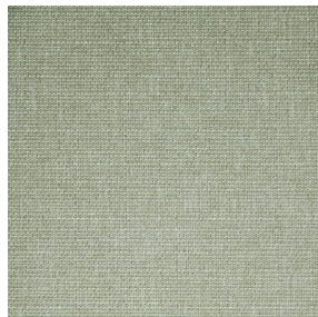
MUNA Sable 67 Motif d'impression