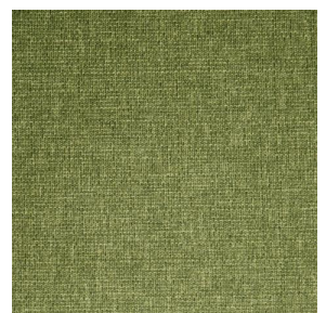
MUNA Olive 61