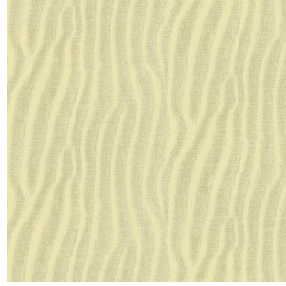
SABLE Sable 67 Motif d'impression