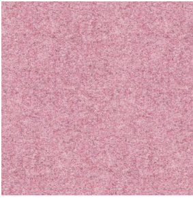
ELAINA Rose 129