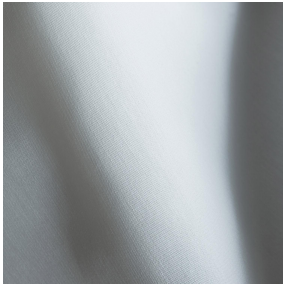
SATIN BPI 00 Support d'impression