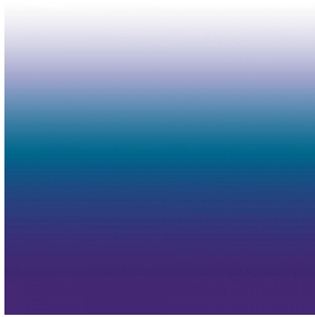
ZADIG Bleu 41 Motif d'impression