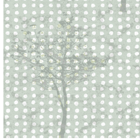
6004 Minéral 157 Motif d'impression