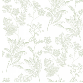
6051 Amande 75 Motif d'impression