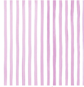
SONG Framboise 81