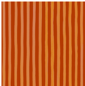
SONG Sanguine 05 Motif d'impression