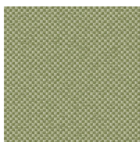
CHARLOTTE Tilleul 103