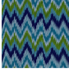
BIJAPUR Bleu 41 Motif d'impression