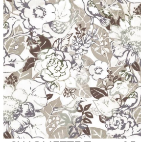
CHARMETTE Taupe 95