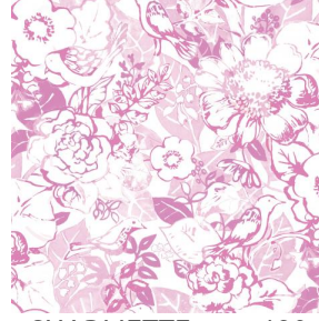
CHARMETTE rose 129