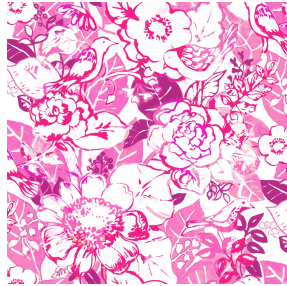
CHARMETTE Fuchsia 33 Motif d'impression