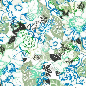
CHARMETTE Turquoise 53