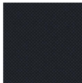
CHARLOTTE Noir 10