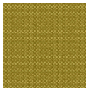
CHARLOTTE Mousse 92