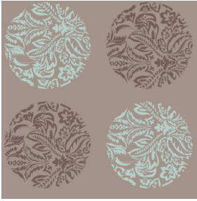
MACARON Lagon 09