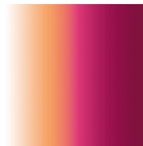
ZENITH Pivoine 57