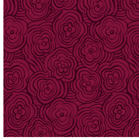
ONDES Opéra 104 Motif d'impression