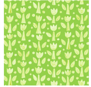
TULIPE Anis 62