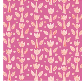
TULIPE Rose 129