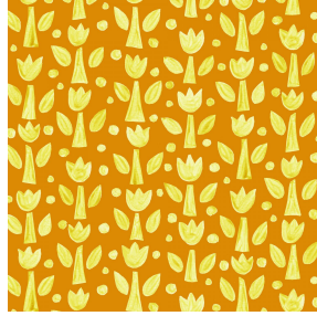
TULIPE Soleil 127 Motif d'impression