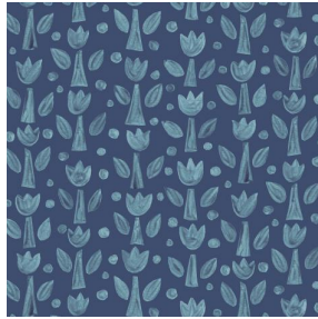
TULIPE Indigo 119