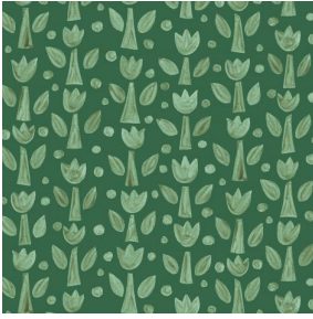
TULIPE Lierre 124