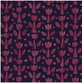
TULIPE Bordeaux 04