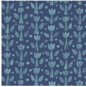
TULIPE Indigo 119