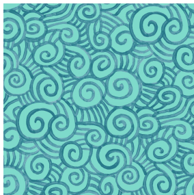
TUMULTE Menthe 122 Motif d'impression