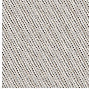
PIERRETTE Naturel 26 Motif d'impression