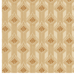
INDIA Naturel 26 Motif d'impression