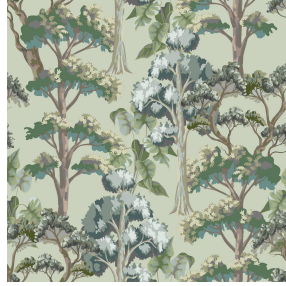
FORET Reflet 140 Motif d'impression