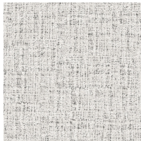
MURA MASTIC 48 Motif d'impression