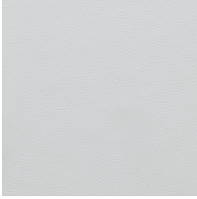
SKAILO Blanc 01 Support d'impression