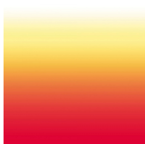
ZADIG Agrume 69 Motif d'impression