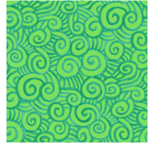
TUMULTE Prairie 125