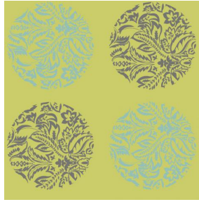
MACARON Mousse 92