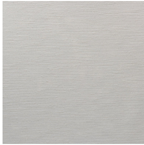
SOLLY BPI 00 Support d'impression