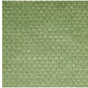
RUSTIC Mousse 92 Motif d'impression