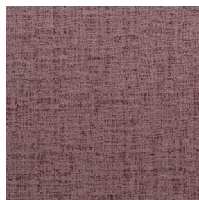
MURA ROSE 129