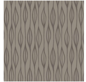
YENDI Terre 107