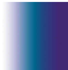
ZENITH Bleu 41