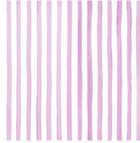
SONG Framboise 81