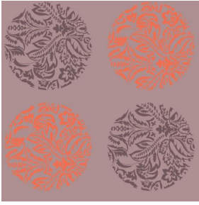
MACARON Orange 15