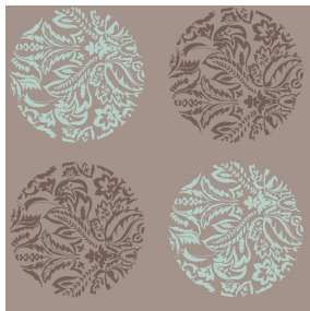
MACARON Lagon 09 Motif d'impression