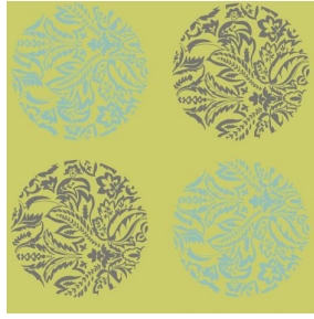
MACARON Mousse 92