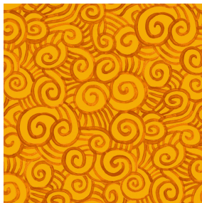
TUMULTE Safran 49 Motif d'impression